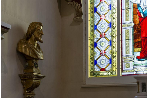
Buste reliquaire, œuvre de Louis Jobin