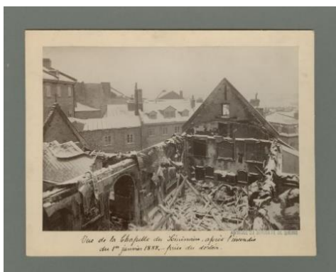
Vue de la Chapelle du Séminaire, après l'incendie du 1 er janvier 1888