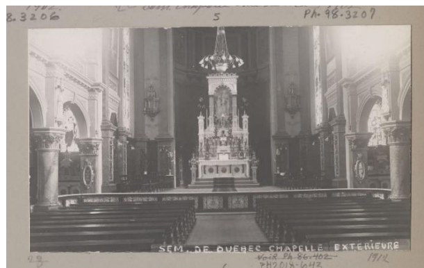
Chapelle extérieure du Séminaire, 1912