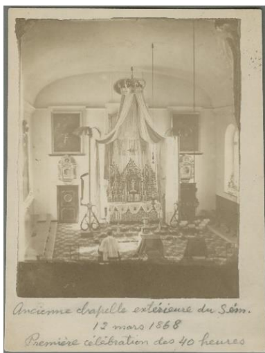
Ancienne chapelle extérieure du Sém. 13 mars 1868 Première célébration des 40 heures

L'actuelle Chapelle du Séminaire de Québec a été bénie en 1900. Le bâtiment précédent avait été érigé vers 1750 et incendié au début de l'année 1888.