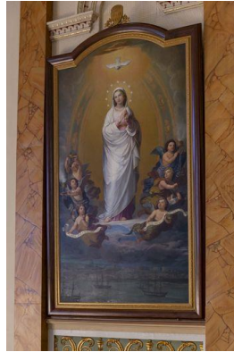
Immaculée Conception en action de grâce pour la protection accordée à l'Université Laval.

Vincenzo Pasqualoni (1820-1880), 1865. Huile sur toile. Musée de la civilisation, collection du Séminaire de Québec.