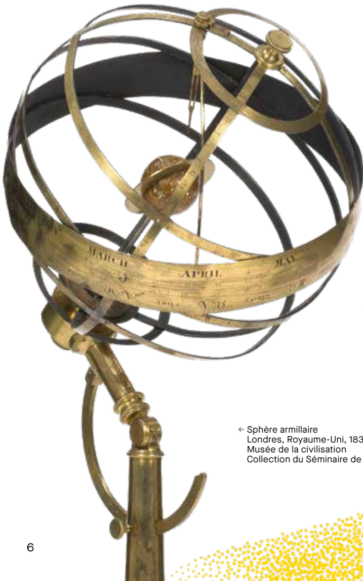
← Sphère armillaire Londres, Royaume-Uni, 1836 Musée de la civilisation Collection du Séminaire de Québec