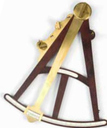
↑ Octant Londres, Royaume-Uni, vers 1790 Musée de la civilisation Collection du Séminaire de Québec

La pandémie a mis en lumière l'importance de la science pour protéger les citoyens et relever des défis communs. Cet événement, pour le moins déstabilisant, a sans doute suscité chez plusieurs un désir d'en apprendre davantage sur la science.